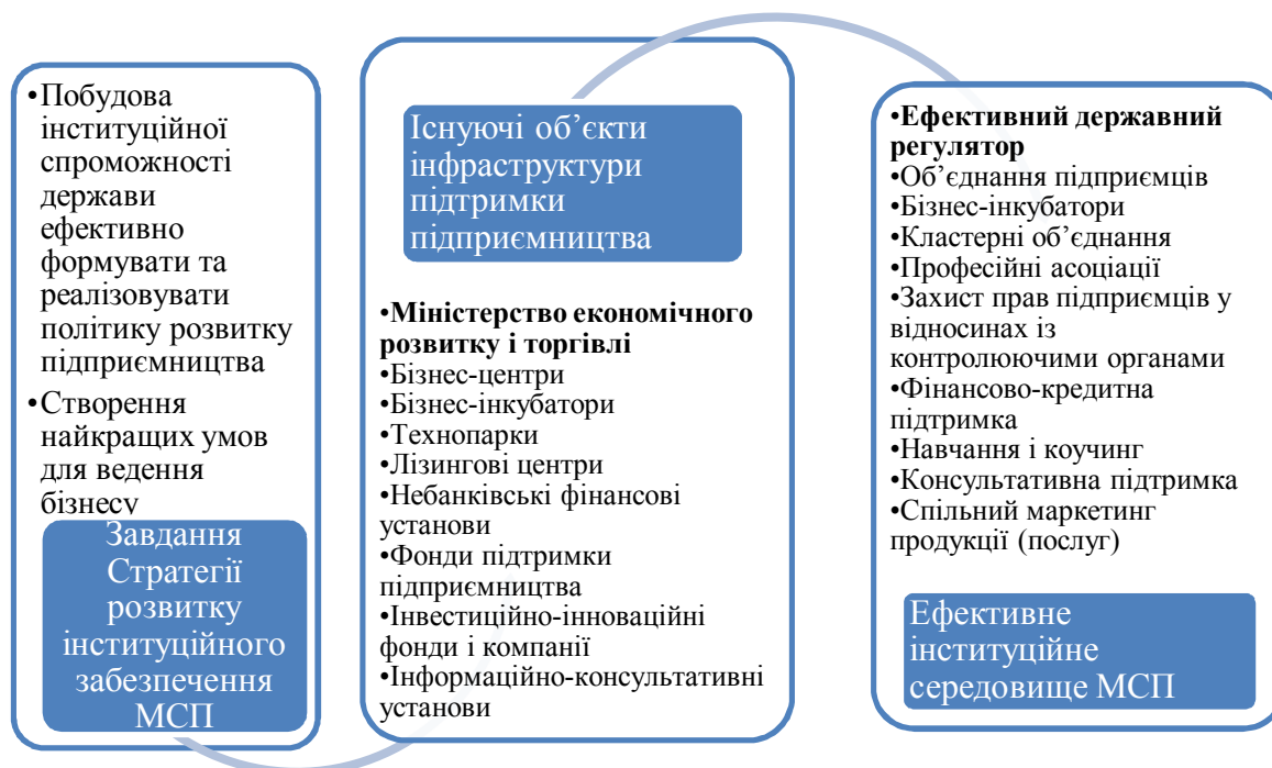
Рис. 1. Трансформація інституційного забезпечення МСП для досягнення стратегічних цілей розвитку