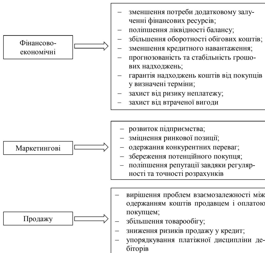
Рис. 2. Основні завдання факторингових розрахунків