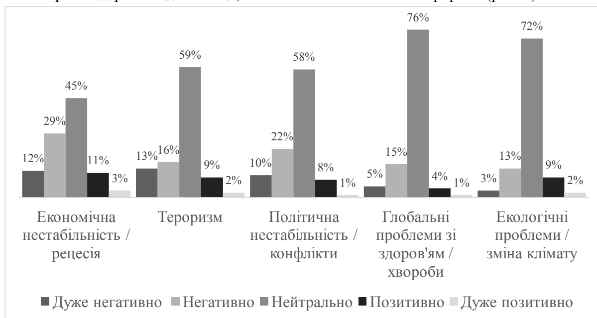
Рис. 2. Фактори, які впливають на розвиток туристичного бізнесу

Якщо проаналізувати фактори, які впливають на розвиток туристичного бізнесу у сфері молодіжного туризму, то найбільш вагомим позитивним чинником буде показник охорони здоров'я в дестинації, а найбільш негативним – тероризм (рис. 2).