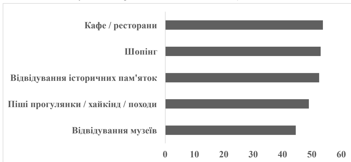
Рис. 3. Особливості молодіжної туристичної індустрії