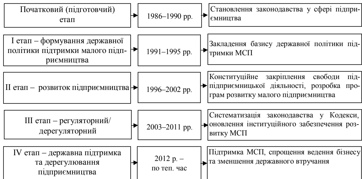
Рис. 1. Періодизація розвитку законодавчого забезпечення підприємництва в Україні

Виклад основного матеріалу. Періодизацію розвитку законодавчого забезпечення підприємництва в Україні представлено на рис. 1.