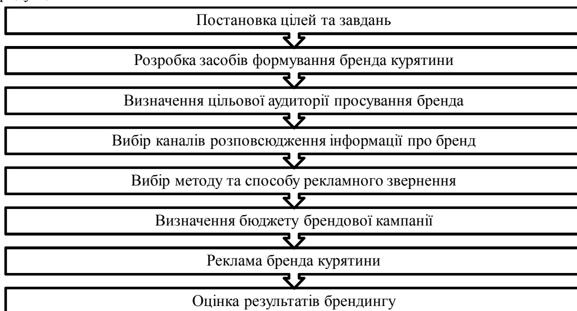
Рис. 1. Етапи розроблення бренда курятини

На першому етапі потрібно визначити цілі та завдання у сфері комунікації та збуту продукції.