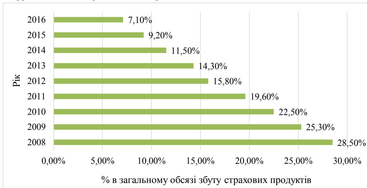
Рис. 3. Динаміка банкострахування в Україні протягом 2008–2016 років Джерело: [1; 2].

Протягом 2008-2016 рр. в Україні у відносинах між певною кількістю банківських установ і страхових компаній у контексті банкострахування спостерігаємо стагнацію. Максимальне значення банкострахування в загальному обсязі збуту страхових продуктів в Україні сягнуло 28,5 % у 2008 році [2], у 2013 р. – 14,3 % [2] і протягом 2008–2016рр. знизилася в 4 рази до 7,1 % (рис. 3).