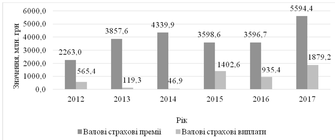
Рис. 2. Динаміка валових чистих страхових премій та виплат при страхуванні кредитів за 2012–2017 роки