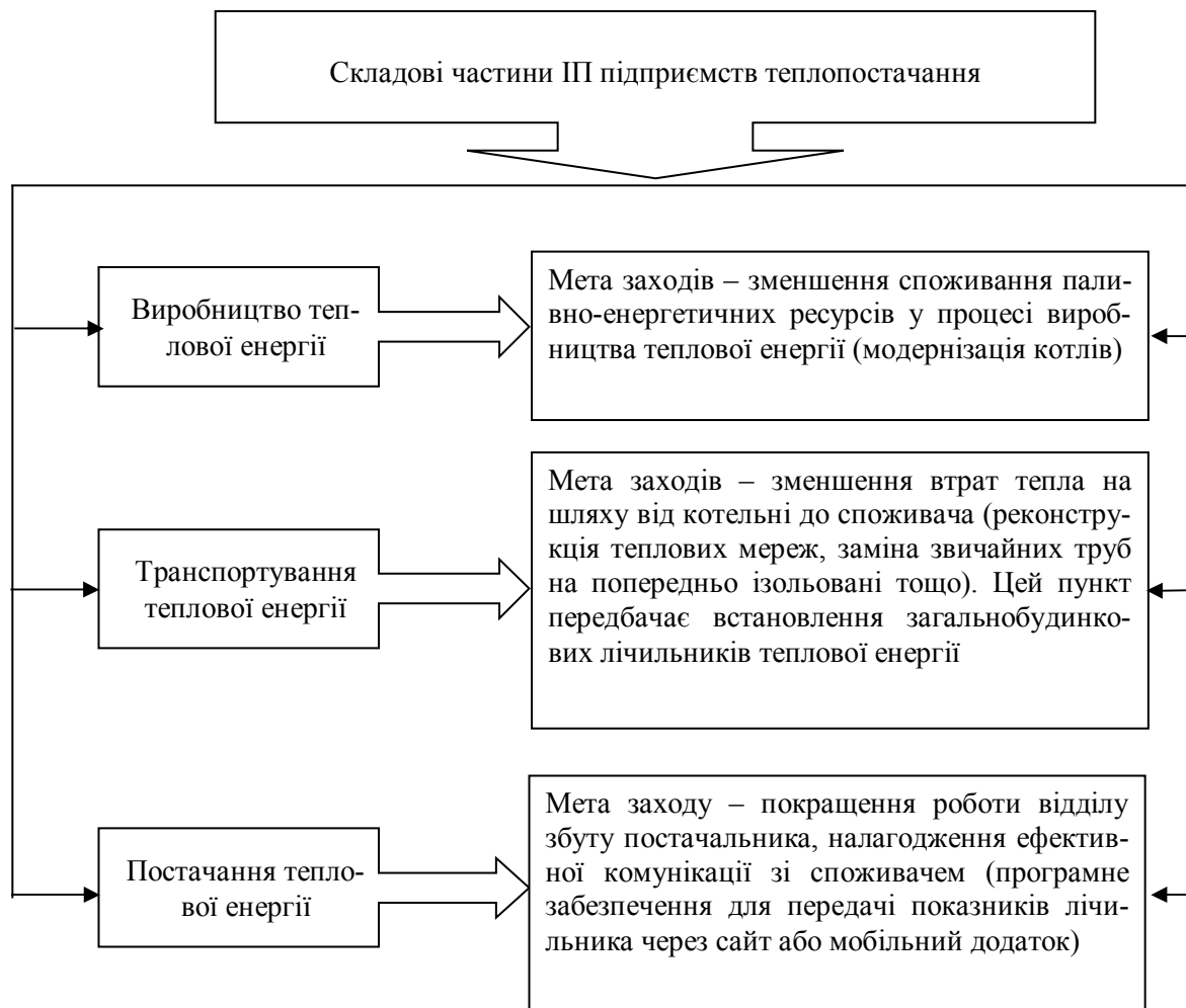
Рис. 2. Складові частини інвестиційної програми підприємств теплопостачання

Відповідно до складових частин ІІІ підприємств теплопостачання (рис. 2) та вимог чинного законодавства, останні повинні містити фінансовий план використання коштів, який визначає очікувані витрати протягом планового періоду (триває 12 місяців, на які здійснюється формування тарифів) [8; 9; 13].