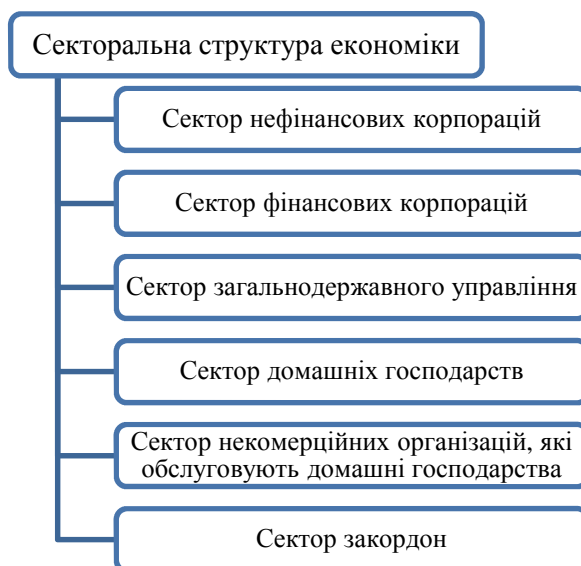
Рис. 3. Інституційні компоненти секторальної структури економіки

Структурування економіки за інституційними секторами. Інституційні сектори економіки являють собою господарські одиниці, які знаходяться в межах економіки і володіють активами, беруть на себе зобов'язання та можуть займатися господарською діяльністю з іншими господарськими одиницями (рис. 3).