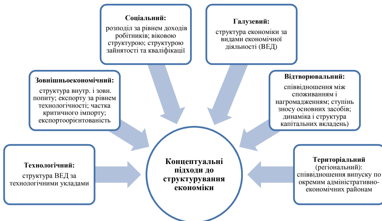
Рис. 1. Концептуальні підходи до структурування економіки

Економічна система є поліструктурним утворенням, тобто їй притаманні різноманітні структури, які характеризуються як сукупність комплексів внутрішніх зв'язків між основними її елементами (сферами, галузями, секторами, регіонами, формами власності тощо) і окремими структурними утвореннями всередині цих елементів, пов'язаних між собою системою суспільного поділу праці. Виокремлюють відтворювальну, техніко-економічну, технологічну, організаційно-економічну, соціально-економічну, галузеву й територіальну (регіональну) структури. Деталізацією цих видів структур є: зовнішньо-економічна, структура власності, структура зайнятості населення, матеріальних і фінансових ресурсів, структура енергозабезпечення тощо (рис. 1).