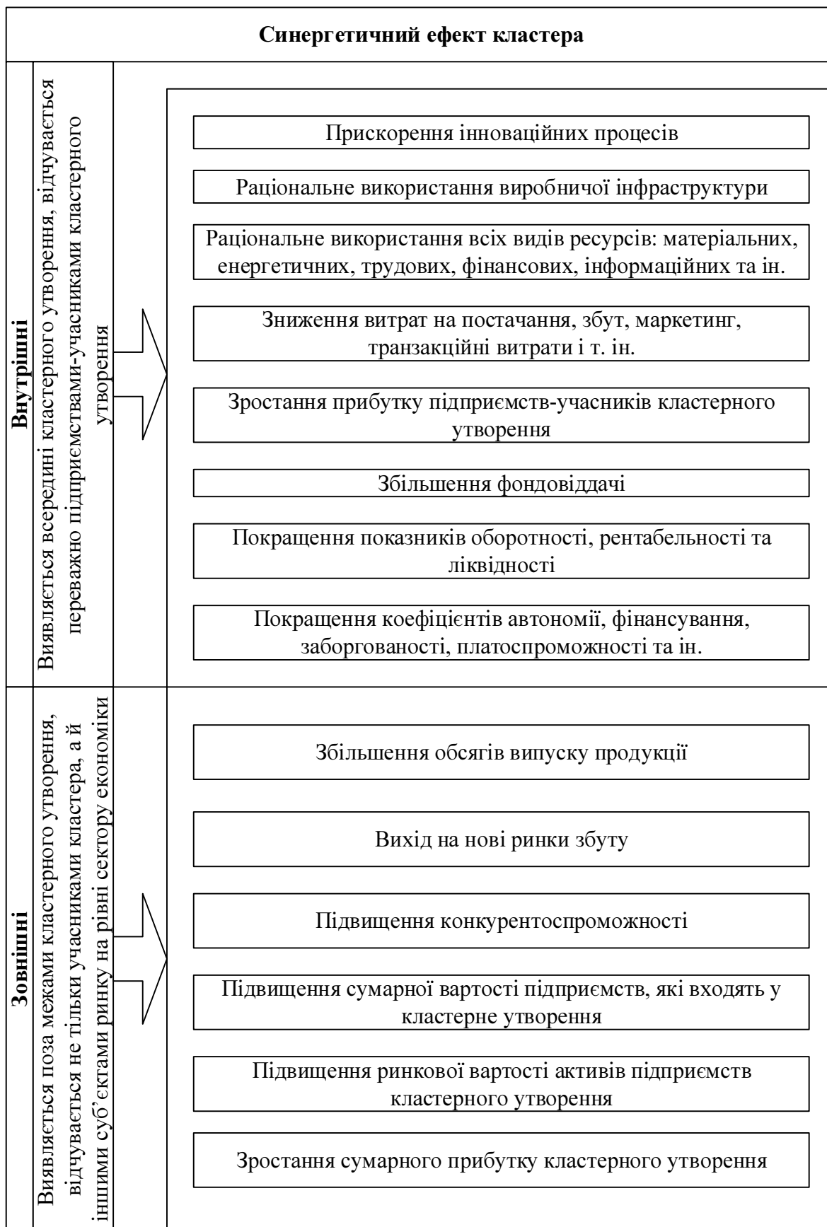
Рис. 3. Складові синергетичного ефекту кластера