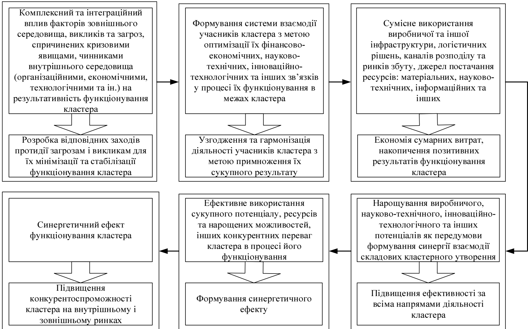
Рис. 2. Схема формування синергетичного ефекту кластера