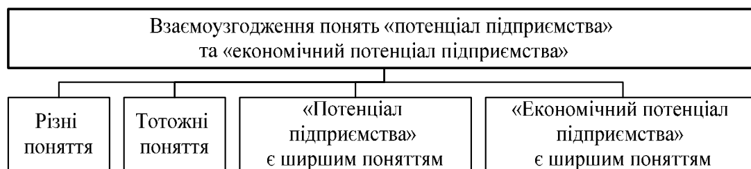
Рис. 2. Взаємоузгодження понять «потенціал підприємства» та «економічний потенціал підприємства»