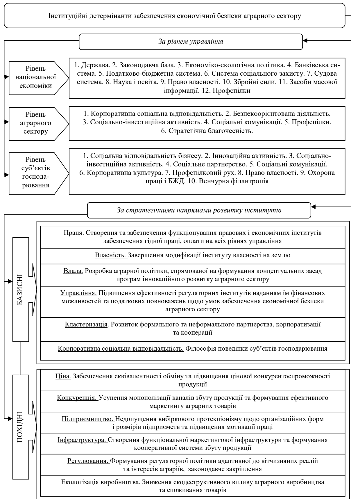
Рис. 1. Інституційні детермінанти забезпечення економічної безпеки аграрного сектору