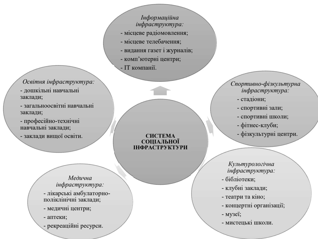
Рис. 1. Компоненти системи соціальної інфраструктури соціогуманітарного простору регіону