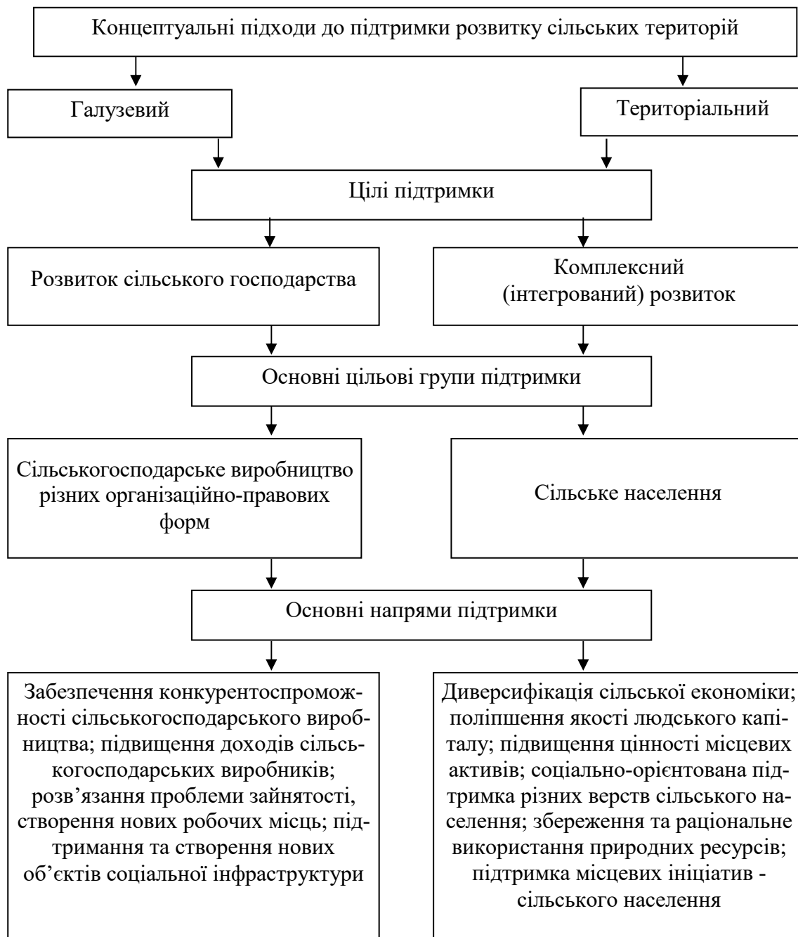
Рис. 2. Напрями розвитку сільських територій

Узагальнення напрацювань українських і закордонних учених, практичних результатів у аграрній сфері дозволило визначити напрями розвитку сільських територій (рис. 2).