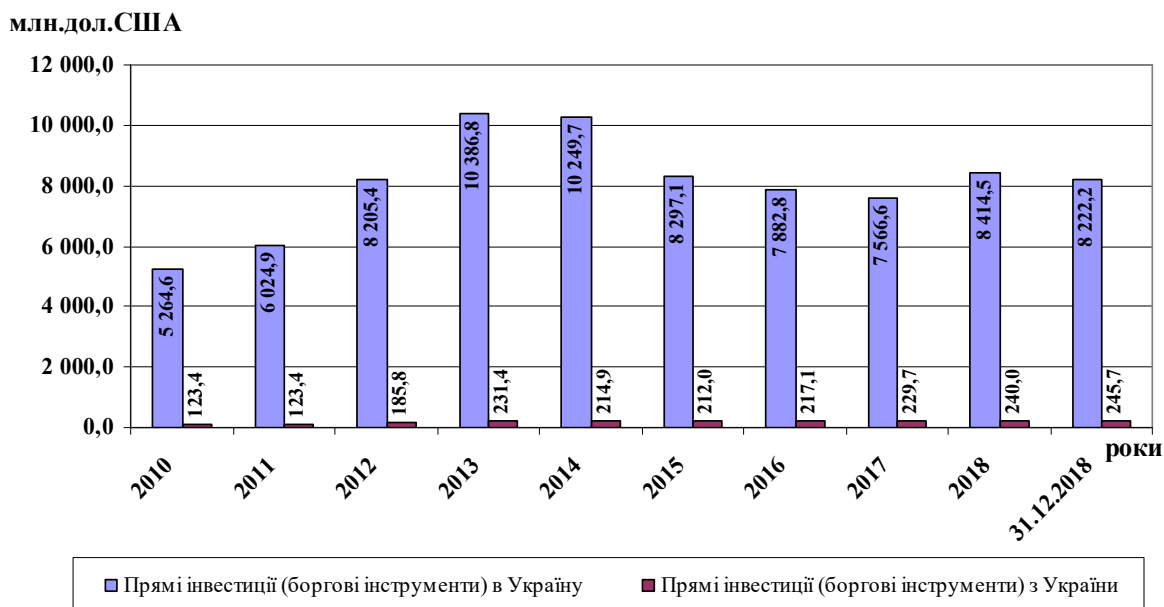
Рис. 2. Надходження / вкладення прямих інвестицій (акціонерного капіталу) у період 2010–2018 рр.