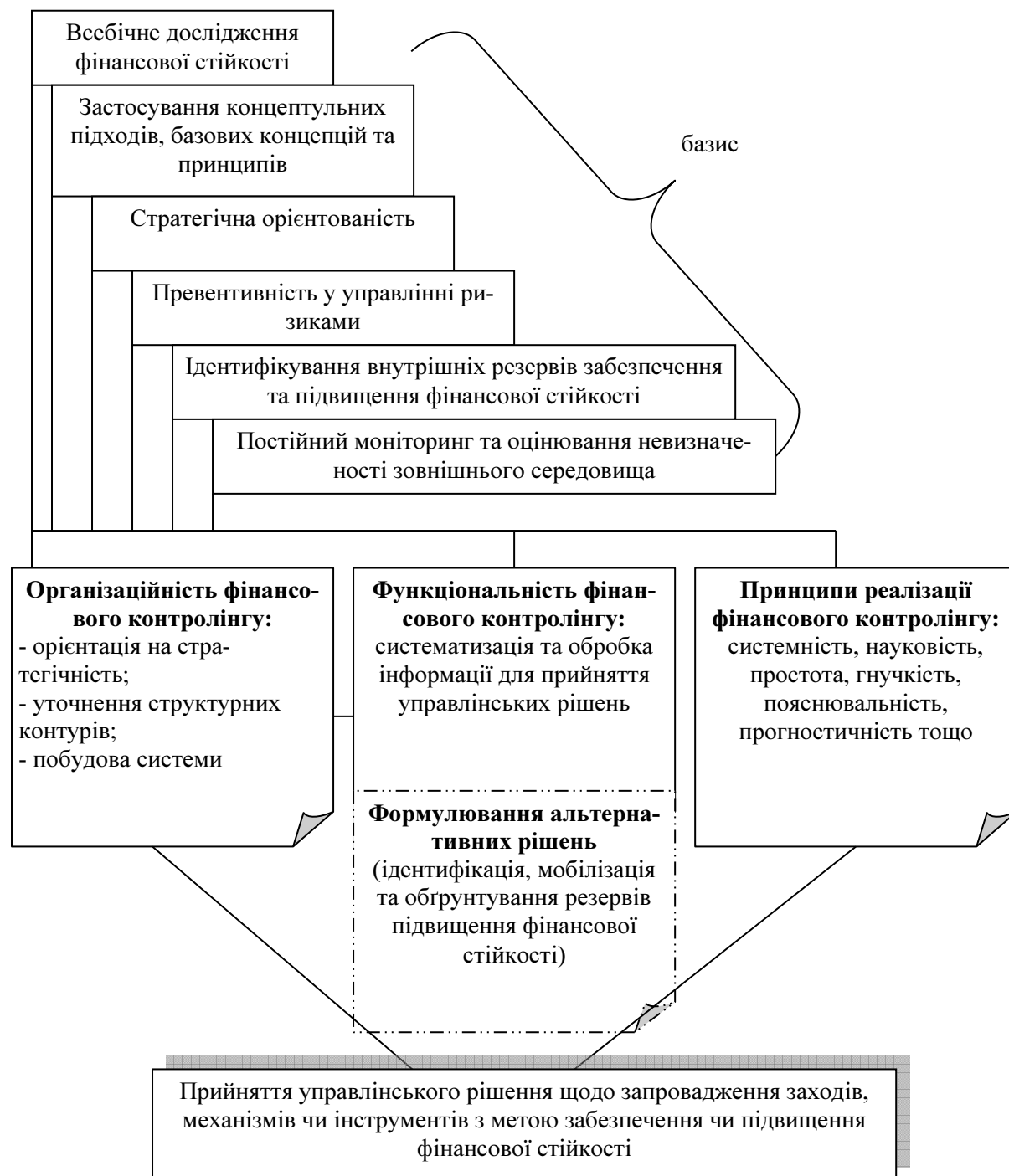
Рис. 3. Сучасна концепція фінансового контролінгу фінансової стійкості суб'єктів господарювання