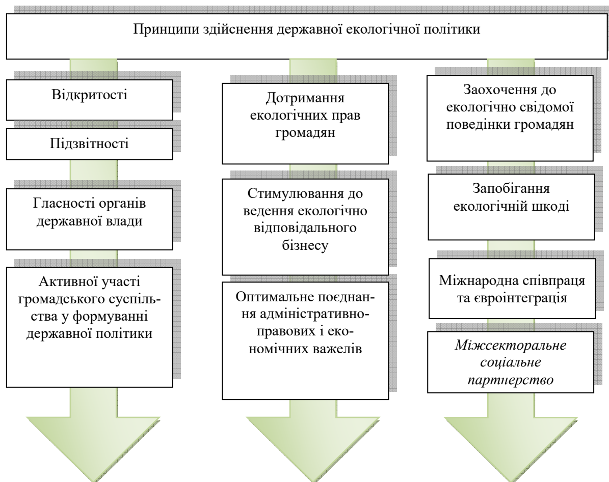
Рис. 3. Принципи здійснення державної екологічної політики

Системний підхід у реалізації державної екологічної політики зумовлює використання таких принципів: відкритості; гласності органів державної влади; підзвітності; активної участі громадського суспільства у формуванні державної політики; дотримання екологічних прав громадян; стимулювання до ведення екологічно відповідального бізнесу; заохочення до екологічно свідомої поведінки громадян; запобігання екологічній шкоді; міжнародна співпраця та євроінтеграція [9] (рис. 3).