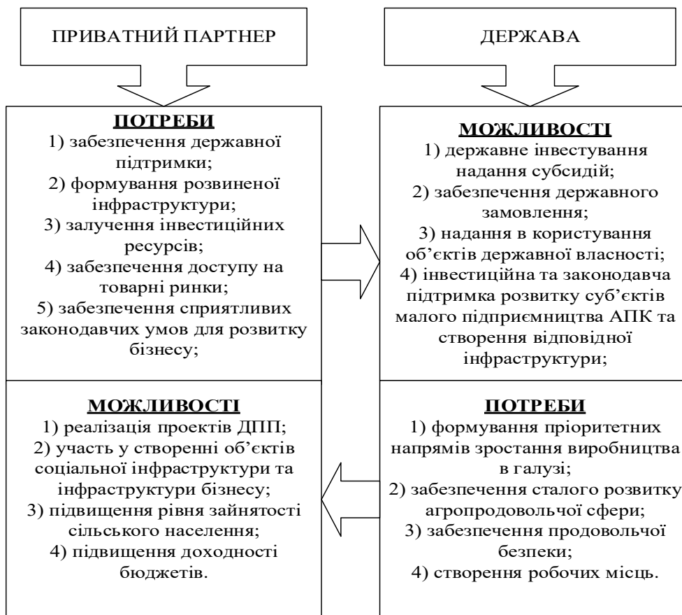
Рис. 1. Взаємодія інтересів держави та приватного партнера в контексті відносин ДПП

Паралельно з впровадженням заходів стратегічного управління розвитком ДПП в АПК формується одне із ключових завдань – пошук балансу між інтересами та стимулами державного та приватного партнерів з урахуванням тих можливостей соціально-економічного розвитку, що виникають завдяки спільним пріоритетам (рис. 1).