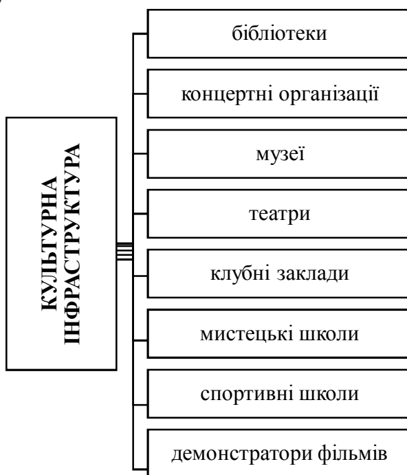
Рис. 1. Складові культурної інфраструктури соціогуманітарного простору

До основних складових культурної інфраструктури, які впливають на формування соціогуманітарного простору та розвиток соціальної інфраструктури загалом, слід віднести: бібліотеки, клубні заклади, театри, концертні організації, музеї, мистецькі та спортивні школи, демонстратори фільмів (рис. 1). Взаємодія окремих компонентів культурної інфраструктури залежить переважно від їхнього характеру, простору обслуговування та рівня доступності.