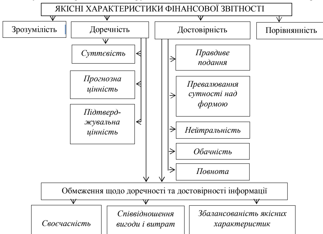
Рис. 1. Якісні характеристики фінансової звітності

У фінансовій звітності наводиться кількісна облікова і необлікова якісна доповнююча інформація. Кількісні показники наводяться в грошовому вираженні, але їх можна перевести у відносні показники. Зведений перелік якісних характеристик фінансової звітності суб'єктів державного сектору за НП(С)БОДС і МСБОДС 1 наведено на рис. 1.