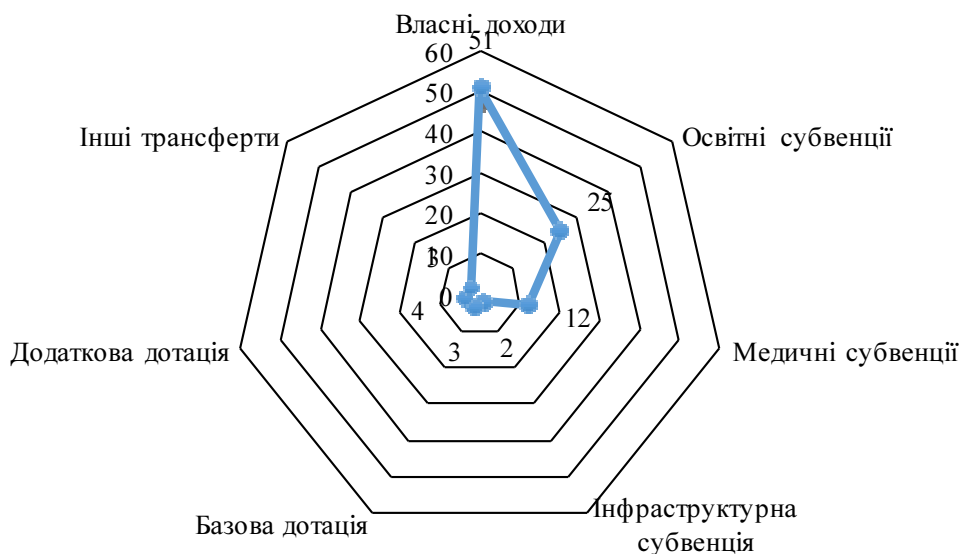
Рис. 1. Структура доходної частини бюджету ОТГ Харківського регіону (%)

По ОТГ Харківської області середній показник виконання плану власних надходжень загального фонду місцевих бюджетів за I півріччя 2018 року становить 111,2 %.