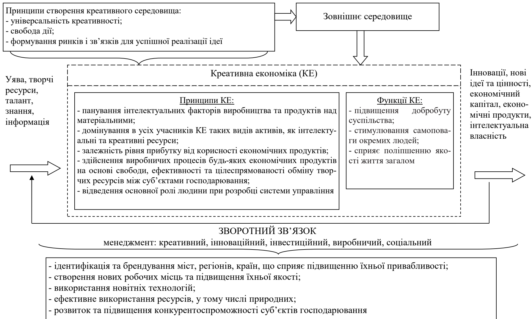
Рис. 3. Креативна економіка як системне явище