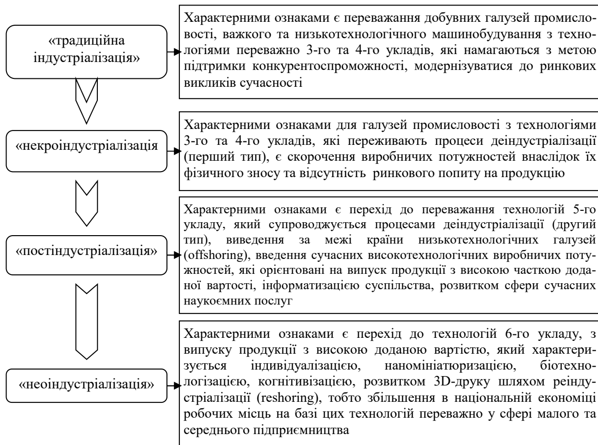
Рис. 2. Наявні погляди щодо сучасних моделей індустріалізації