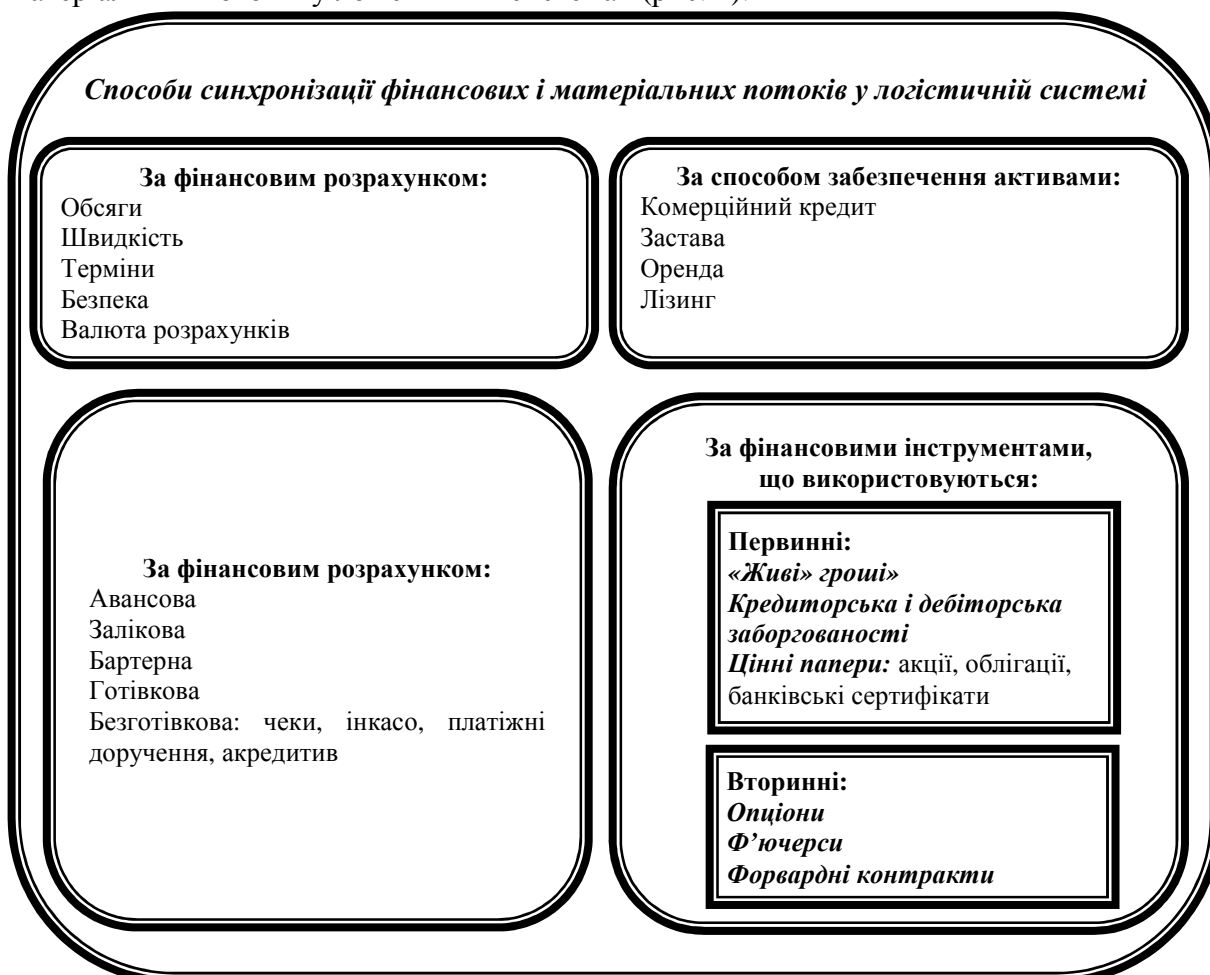
Рис. 2. Класифікація основних способів синхронізації фінансових і матеріальних потоків у логістичній системі

У сучасних умовах проблемою залишається механізм синхронізації фінансових та матеріальних потоків у логістичних системах (рис. 2).