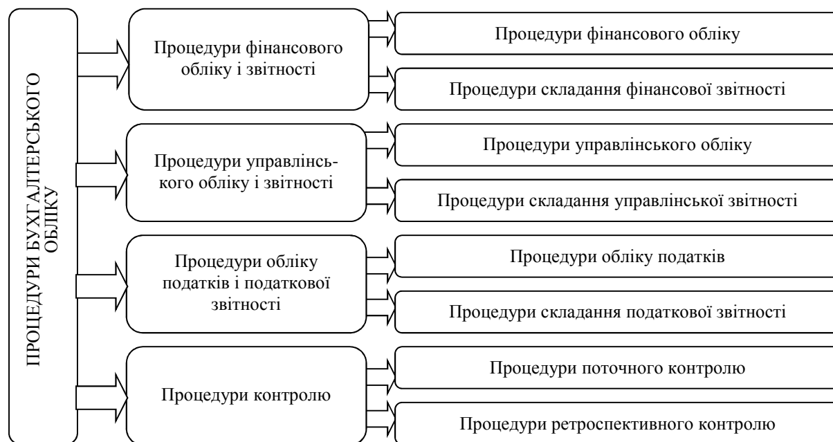
Рис. 3. Ієрархічна класифікація процедур бухгалтерського обліку

На рис. 2 нами вже запропонована структура процедур бухгалтерського обліку за ознакою відношення до господарської операції. Ієрархічна структура процедур бухгалтерського обліку наведена на рис. 3.