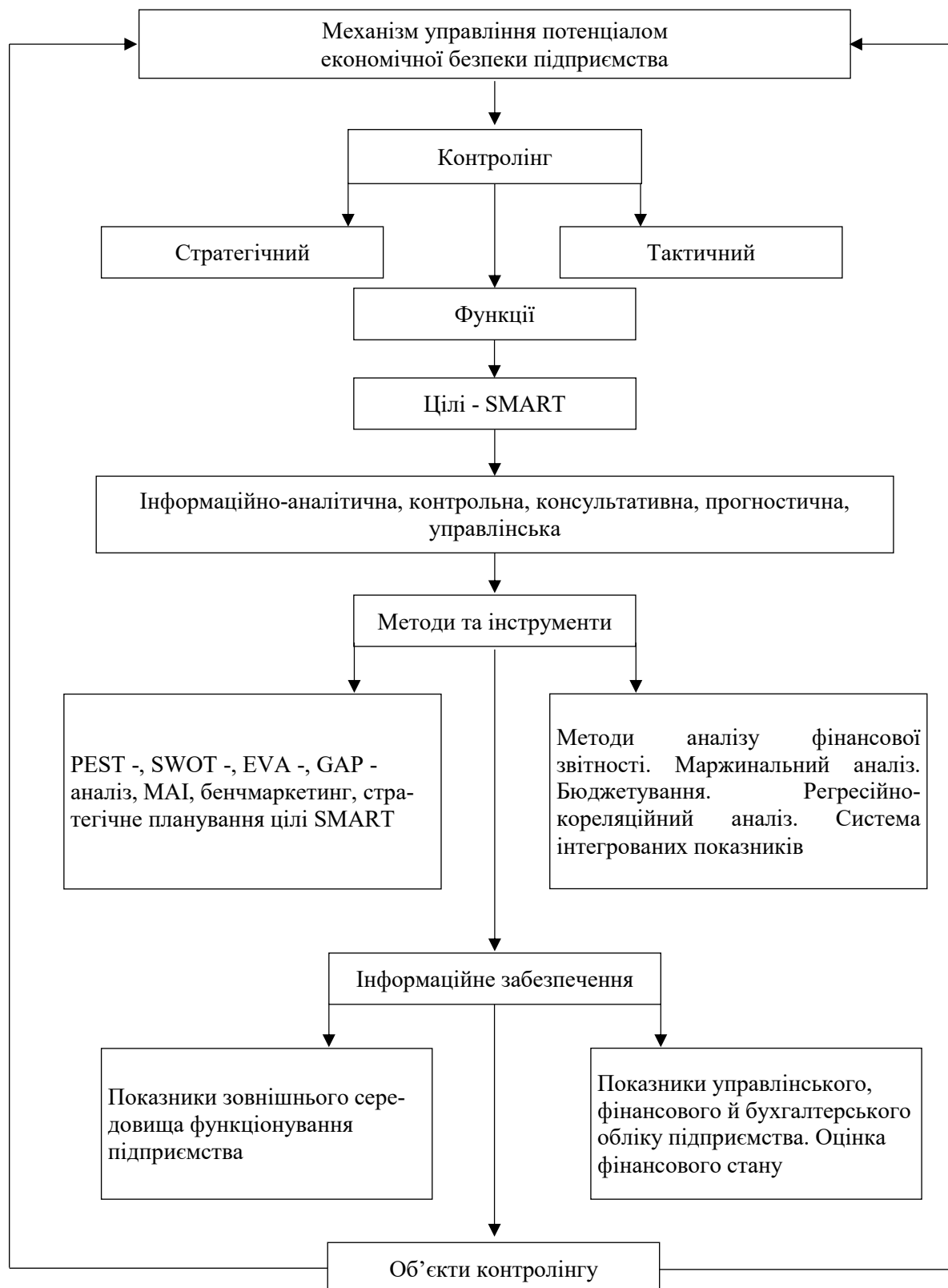
Рис. 3. Система контролінгу підприємства