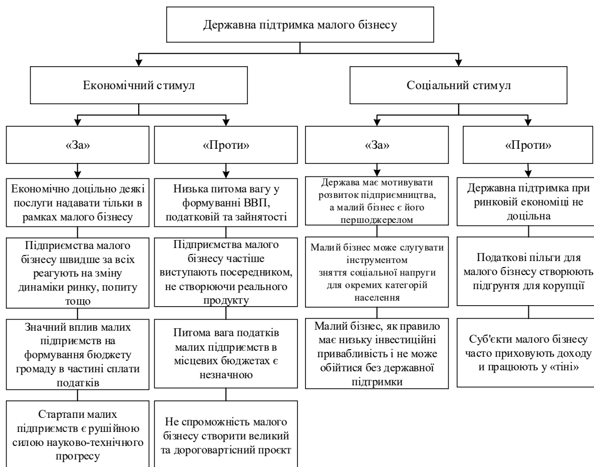
Рис. 2. Аргументи, щодо необхідності державної підтримки малого підприємництва

На нашу думку, для проведення державної підтримки розвитку малого підприємництва необхідно підходити виважено, з врахуванням фінансового становища держави та всебічно оцінювати доцільність такої підтримки.