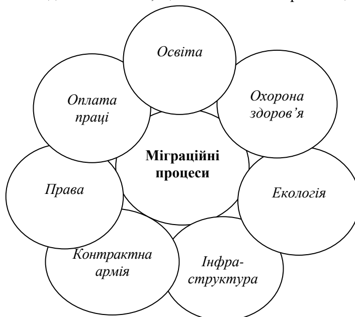
Рис. 2. Інституційні фактори, що впливають на міграційні процеси

Завдання створення сприятливих умов для утримання фахівців є надзвичайно актуальною для України, у тому числі для її інноваційного розвитку, і включає багато питань соціального характеру, а саме: якості правосуддя, особистої безпеки, охорони здоров'я, освіти, екології, інфраструктури, контрактної армії, доступності споживчих кредитів, монополізації ринків (що впливає на вартість життя) та багато інших [17]. Вплив на міграційні процеси є комплексним та складним питанням, що зачіпає основи організації держави (рис. 2).