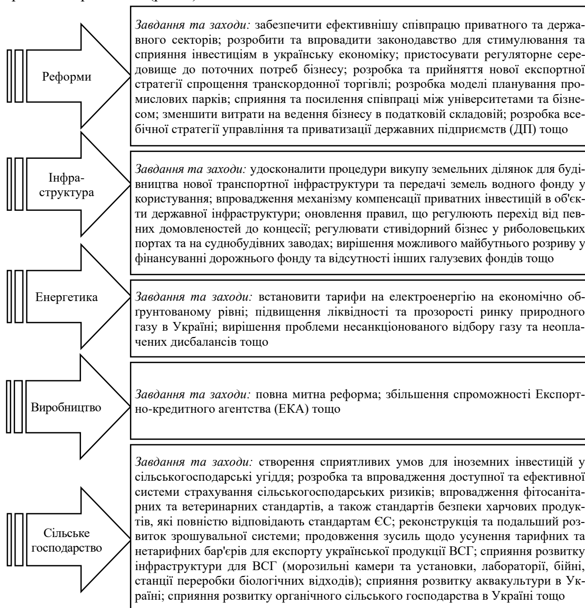
Рис. 3. Стратегія розвитку АПК України

На основі вищевикладеного, нами визначено стратегія розвитку АПК України, де визначено завдання і заходи, які необхідно виконати в короткостроковій або середньостроковій перспективі (рис. 3).