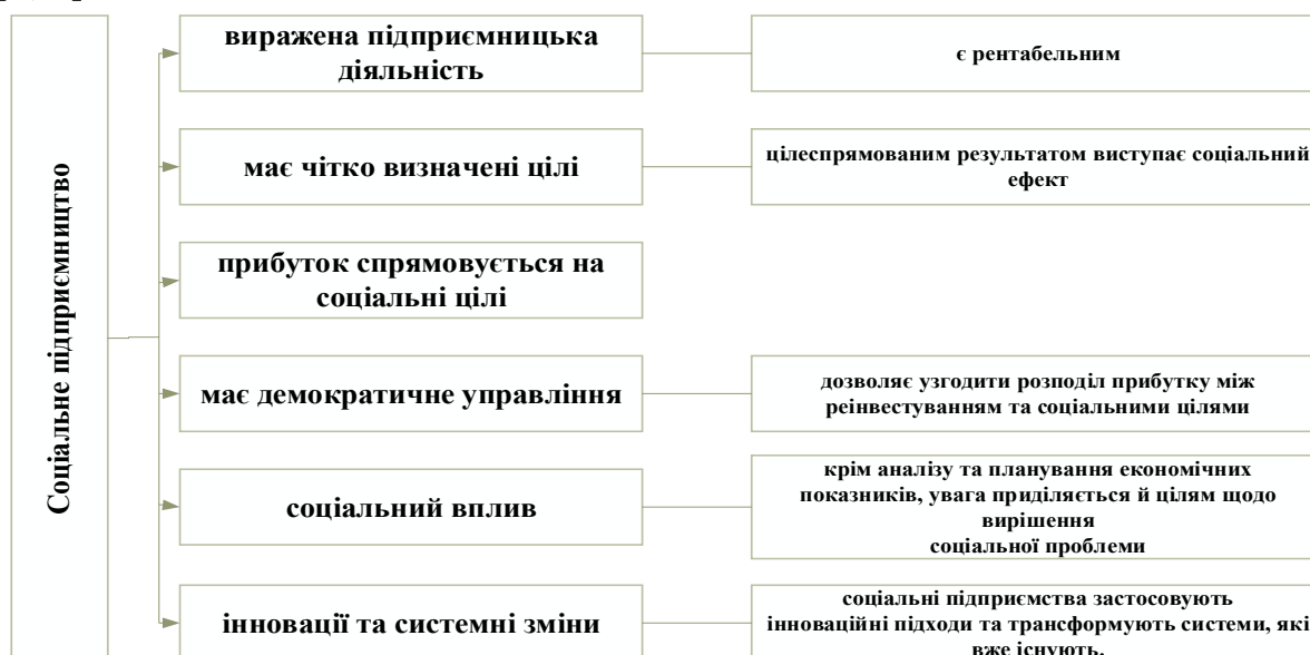
Рис. 1. Критерії визначення соціального підприємництва

Критерії визначення соціального підприємництва, наведено на рис. 1 [1; 3].