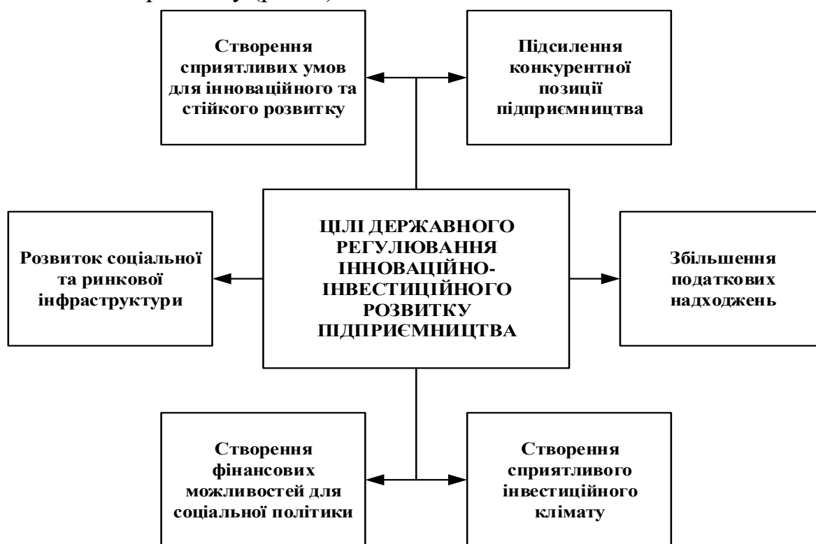
Рис. 1. Основні цілі державного регулювання інноваційно-інвестиційного розвитку підприємництва

На основі визначення основних тенденцій державного регулювання інноваційно-інвестиційного розвитку підприємницької діяльності за сучасних умов слід зауважити, що останніми роками фокус змістився до активної участі держави в організаційно-економічному регулюванні інноваційно-інвестиційного розвитку (рис. 1).