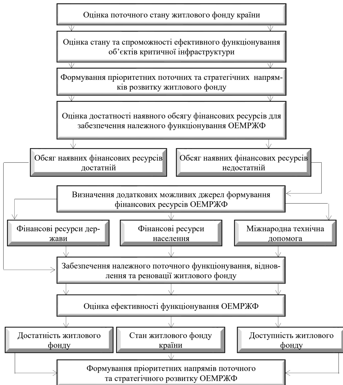
Рис. 2. Перманентний алгоритм розвитку житлового фонду країни

Дія організаційно-економічного механізму розвитку житлового фонду повинна носити системний та безперервний характер, а також бути підпорядкована певному алгоритму його реалізації (рис. 2).