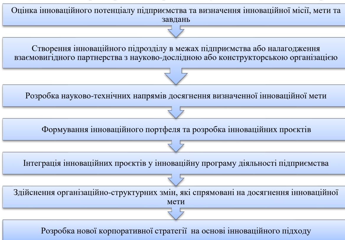
Рис. 3. Основні етапи організації інноваційної діяльності на підприємстві

Досвід діяльності багатьох західних корпорацій свідчить, що не всі інноваційні проєкти мають позитивні результати й навіть ті, що передбачають створення унікальних якостей товару. За різними аналітичними оцінками приблизно 70 % усіх науково-технічних розробок залишаються не використаними в практичній діяльності. Таким чином, успіх впровадження інноваційної діяльності залежить від багатьох факторів, серед яких важливе значення має достовірне визначення перспектив представлення підприємством