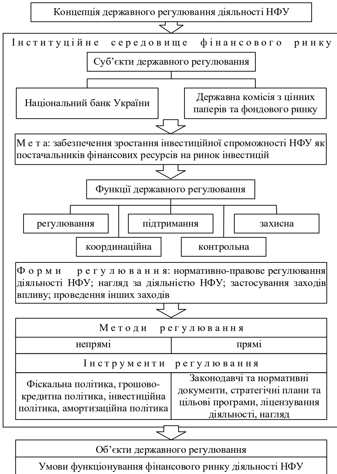
Рис. 1. Концепція державного регулювання діяльності НБУ