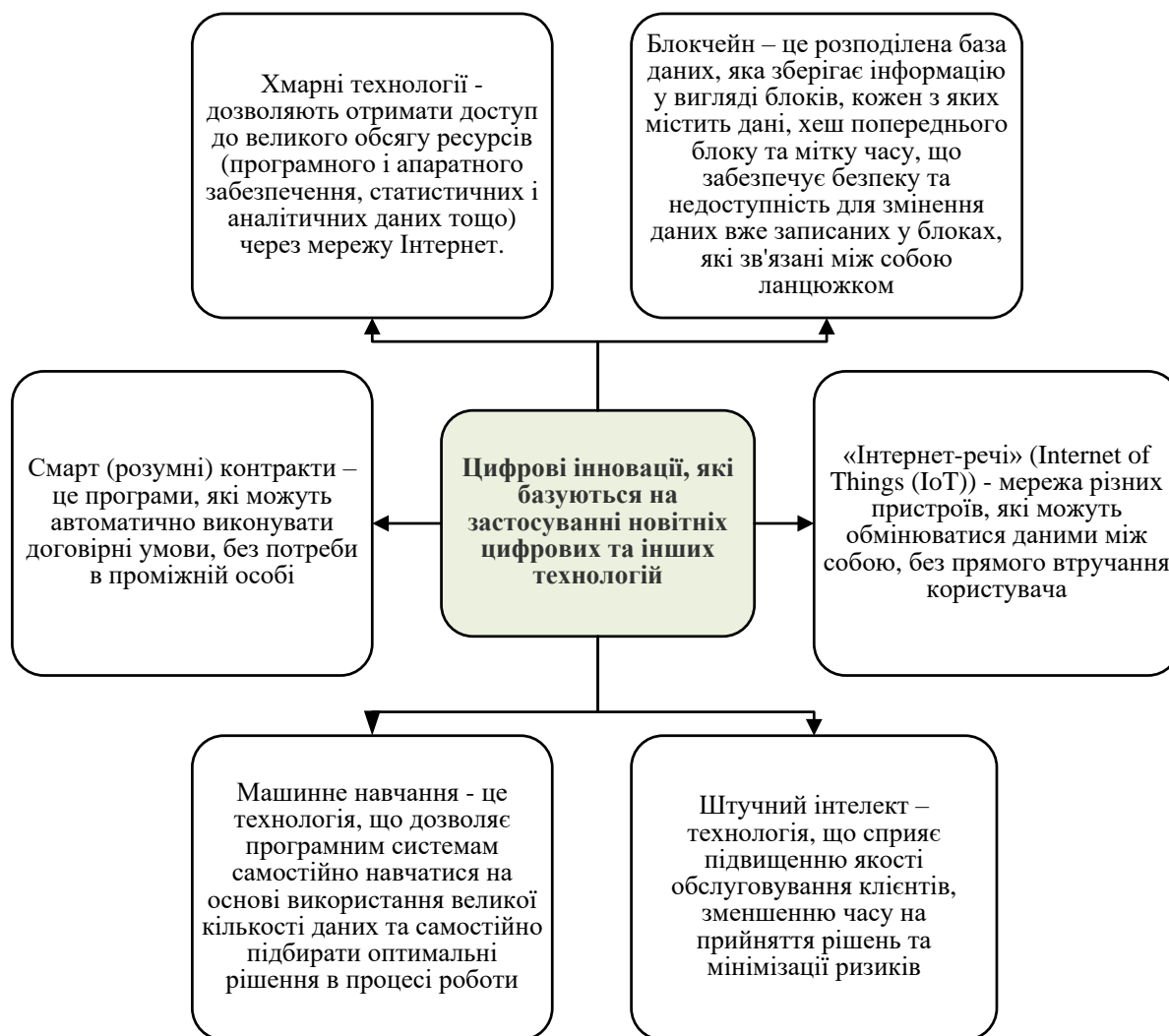
Рис. 2. Підвиди цифрових інновацій, які базуються на застосування новітніх цифрових та інших технологій

За характером впровадження розрізняють цифрові інновації, які базуються на застосуванні новітніх цифрових та інших технологій (блокчейн, хмарні технології, машинне навчання, штучний інтелект смартконтракти, інтернет речей (рис. 2)) і інновації, які базуються на зміні підходів до бізнес-процесів та управління організацією.