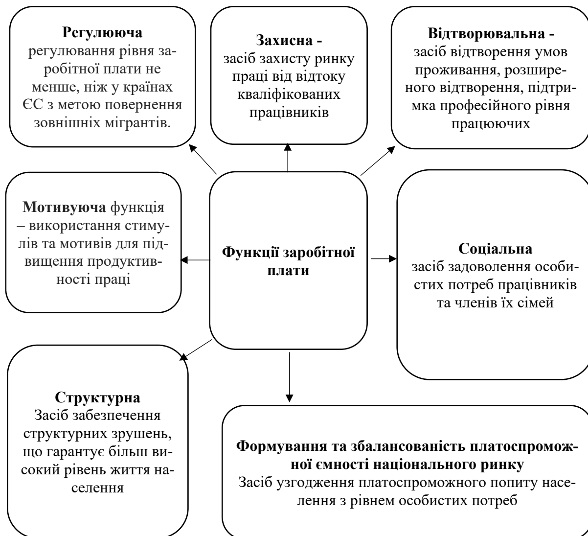
Рис. 2. Функції заробітної плати. Посилення мотиваційної ролі заробітної плати у воєнний та післявоєнний період в Україні