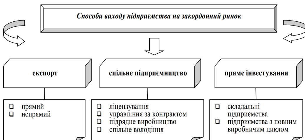
Рис. 2. Способи виходу підприємства на закордонний ринок

Використання цифрового маркетингу доцільно саме при експорті товару. Особливо ефективним цей інструмент буде на початкових стадіях міжнародної торгівлі. Продажі за допомогою Інтернету дозволяють на практиці перевірити конкурентні переваги компанії та мінімізувати потенційні втрати в разі помилок з вибором маркетингової стратегії.