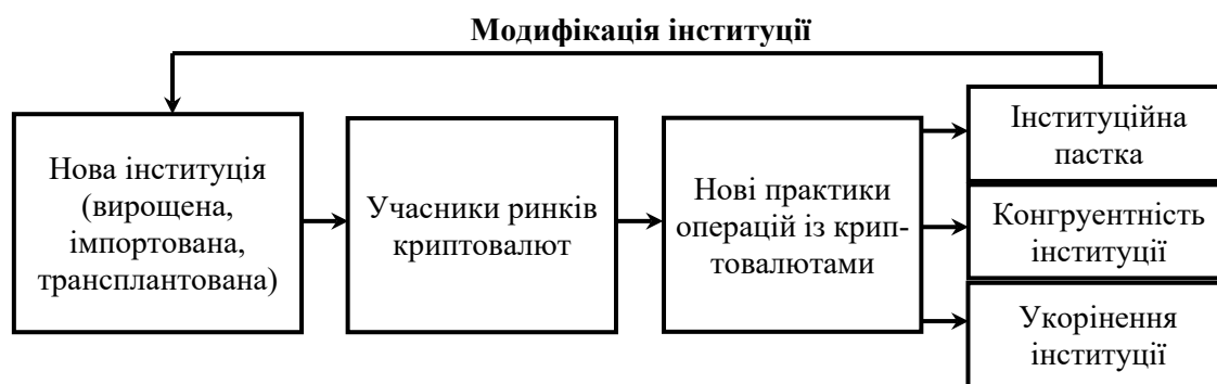
Рис. 4. Процес інституційних трансформацій на ринках криптовалют

Інституційні трансформації на ринках криптовалют – це процес становлення та розвитку їхніх інститутів-учасників та інших суб’єктів, які впроваджують притаманні ним інституції у фінансові операції з криптовалютами; упорядкування цієї діяльності через офіційні (тверді) обмеження фінансової поведінки з механізмами примусу за існування неофіційних (м’яких) обмежень. З кожним новим офіційним обмеженням учасники ринків криптовалют функціонують у новому фінансовому просторі, однак, якщо воно не є ефективним, через орган-регулятор (державний або ОПУ/СРО) вони модифікують його відповідно до своїх потреб. Отже, офіційні обмеження пристосовуються і відфільтровуються мікроекономічним середовищем. У такому випадку інституція стає ефектором, що спроможна змінювати розповсюджену практику операцій з криптовалютами, тобто вона є інструментом досягнення суспільних цілей.