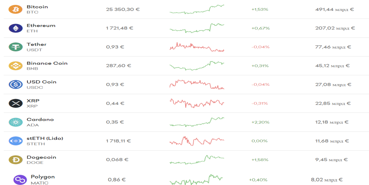
Рис. 2. Ціна і ринкова капіталізація основних криптовалют на кінець травня 2023 р. [22]

Щодо досліджуваних нами інституційних трансформацій на міжнародних і національних ринках криптовалют, то варто виходити з того, що ключовою категорією залишаються інституції.