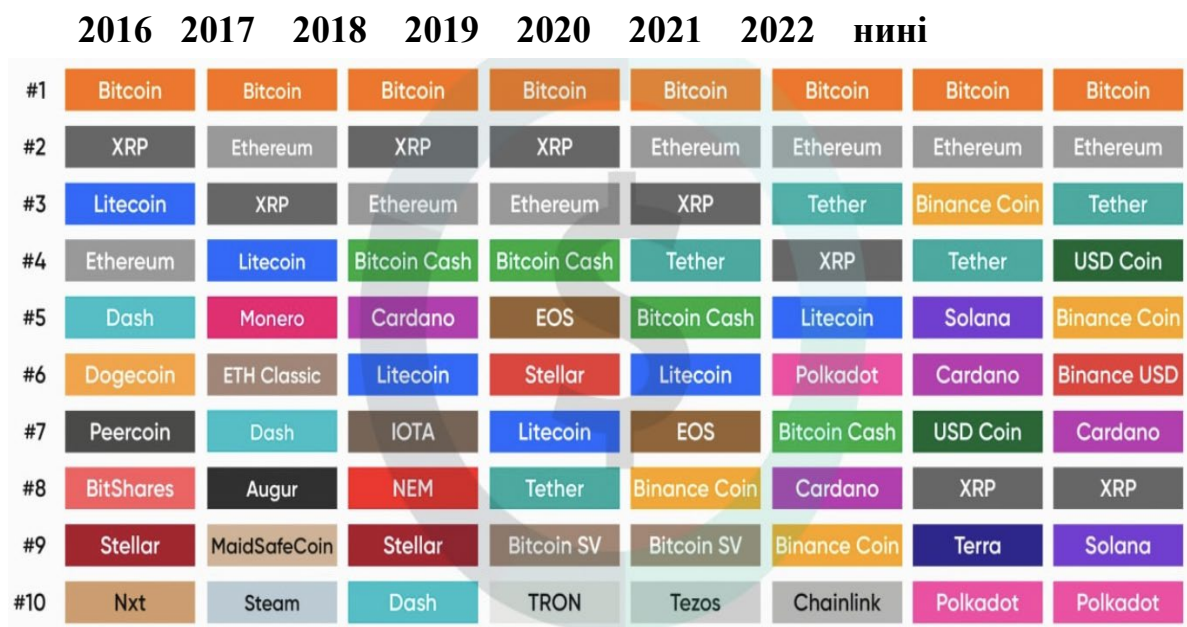
Рис. 1. Рейтинги криптовалют у 2016–2023 рр. [20]

основні проблеми щодо її обігу, які полягають у невизначеності правового статусу криптовалют, методиці обліку операцій, а також неврегульованості питань щодо їх оподаткування. Усі ці вони пов'язані з необхідністю інституціоналізації ринків криптовалют і подальших трансформацій на них.