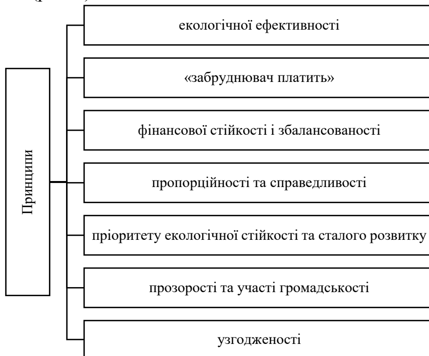
Рис. 1. Принципи фінансової політики природокористування

Фінансова політика природокористування повинна будуватися на основі певних принципів, які мають спрямовуватися на забезпечення сталого розвитку, екологічної збалансованості та ефективного використання природних ресурсів (рис. 1).