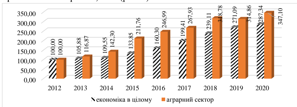
Рис. 2. Динаміка зміни валової доданої вартості за аграрним сектором та економікою загалом за період 2012-2020 рр. (%)

Розглядаючи динаміку зміни частки аграрного сектору у валовій доданій вартості в структурі економіки, то можна зробити висновок, що до 2018 р. було збільшення показника, у той час як у 2019 році відбулось зниження в порівнянні з 2018 р. на 3,92 % (рис. 2).