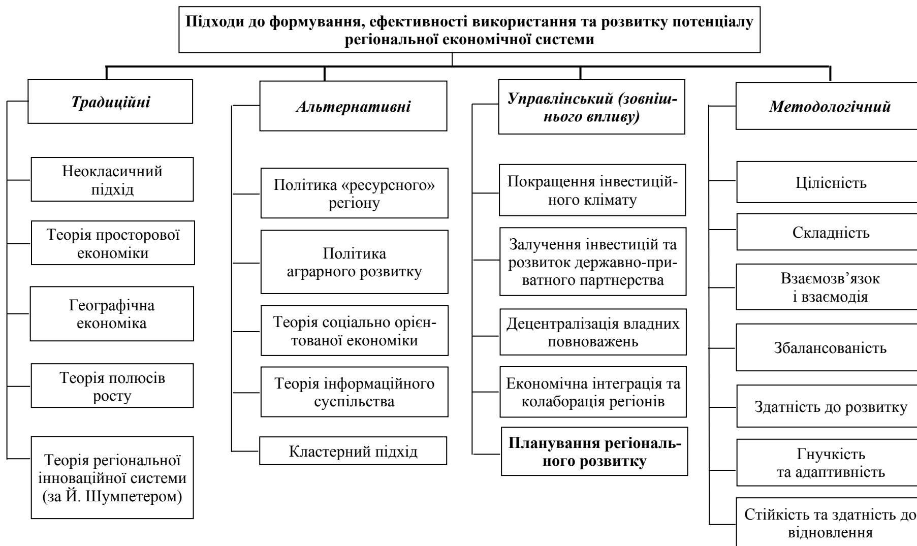
Рис. 1. Схема факторів ефективності використання сукупного потенціалу транспортної системи регіону