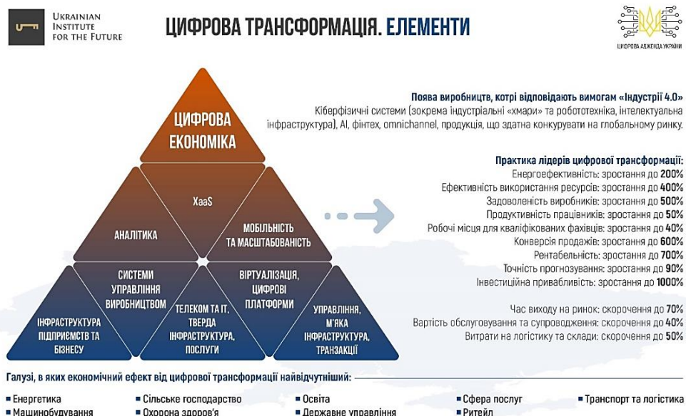
Рис. 4. Цифрова трансформація

управлінські, організаційні, інвестиційні та фінансові аспекти. Синхронний розвиток цих двох сфер на основі ринкових механізмів і державної політики «смартактивізму» дозволить економічним секторам і сферам життєдіяльності зробити значні прориви протягом кількох років, замість десятиліть, і перейти від застарілих умов до сучасних або навіть передових технологічних середовищ, здійснивши так званий цифровий стрибок (рис. 4) [11].