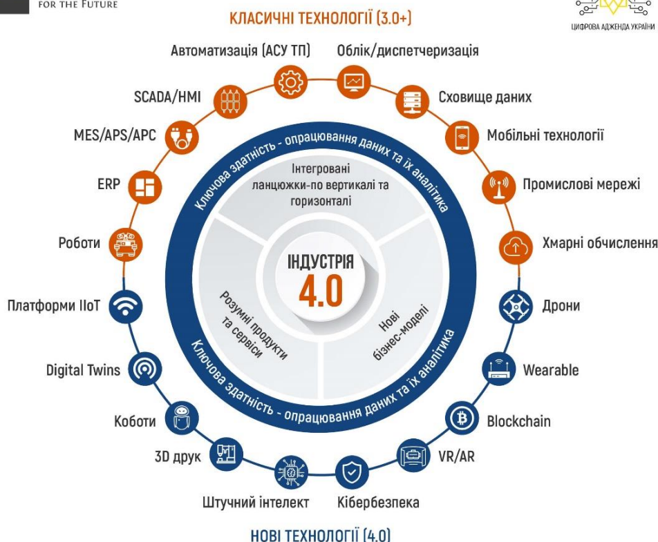
Рис. 2. Ключові технології цифрових трансформацій