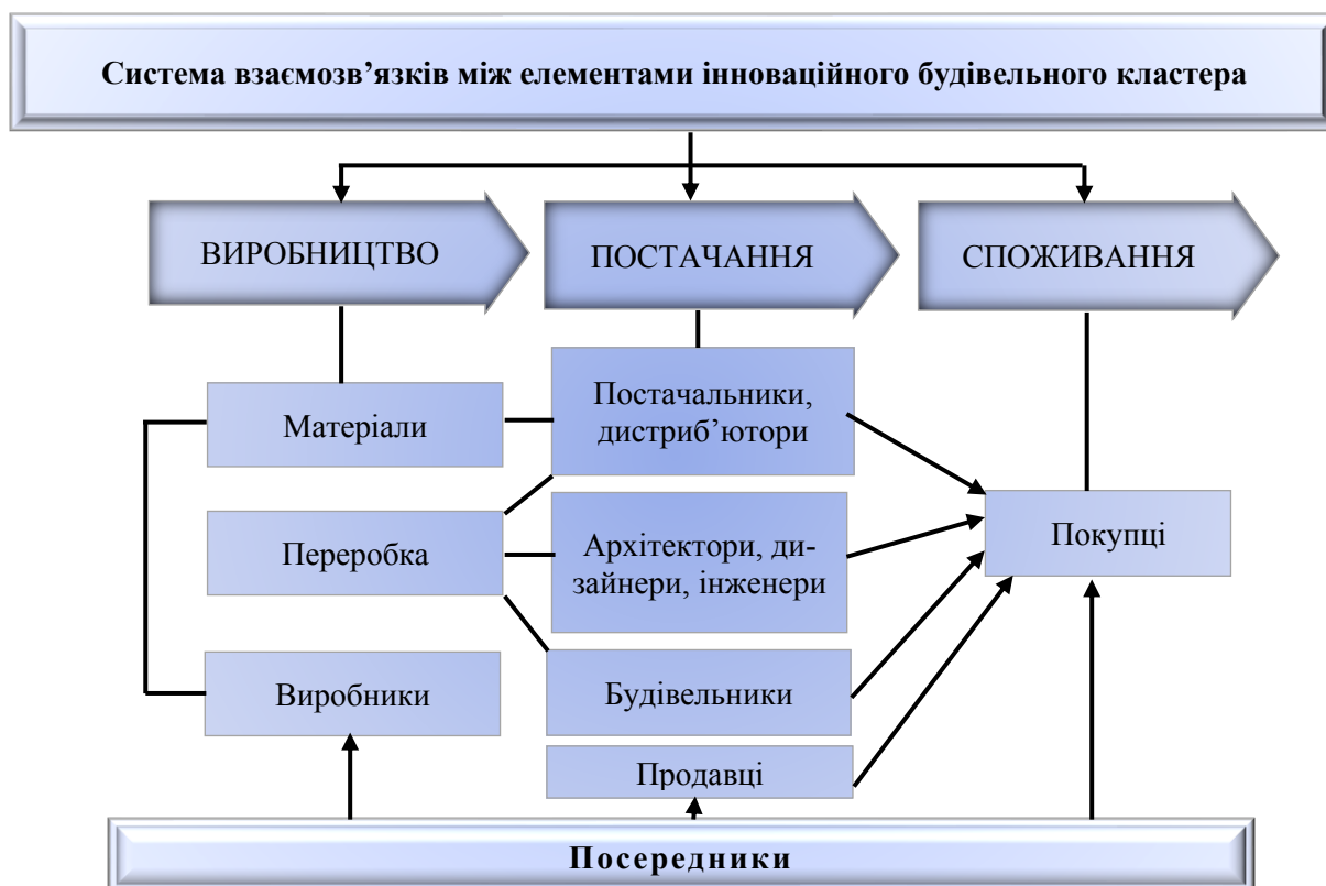
Рис. 1. Система відносин основних учасників інноваційного будівельного кластера