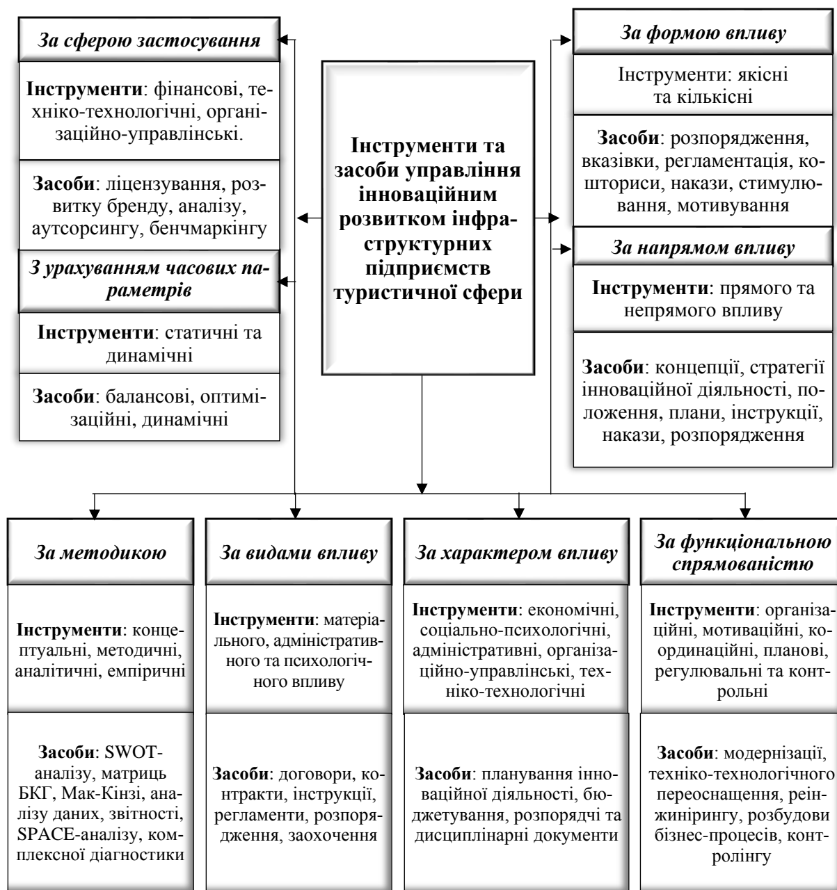
Рис. 2. Узагальнена класифікація інструментів та засобів управління інноваційним розвитком інфраструктурних підприємств туристичної сфери

Фінансові інструменти, які на нашу думку можуть бути застосовані в українській туристичній інфраструктурі, включають різноманітні методи та інструменти залучення та управління фінансами з метою покращення та розвитку туристичної галузі, у тому числі банківські кредити та позики, залучення інвестиційних ресурсів, лізинг, гранти й субсидії від держави чи міжнародних організацій, інвестиційні партнерства та публічно-приватні партнерства, кожен з яких має свої переваги, недоліки й обмеження застосування (табл. 2).