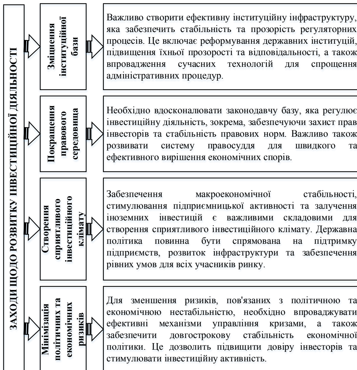
Рис. 2. Заходи щодо розвитку інвестиційної діяльності