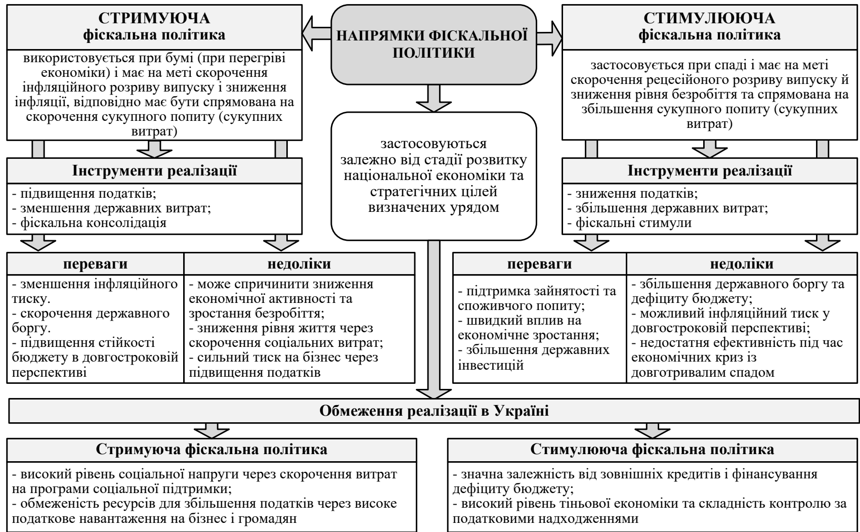
Рис. 1. Характеристика напрямів фінансової політики та інструментів їх реалізації