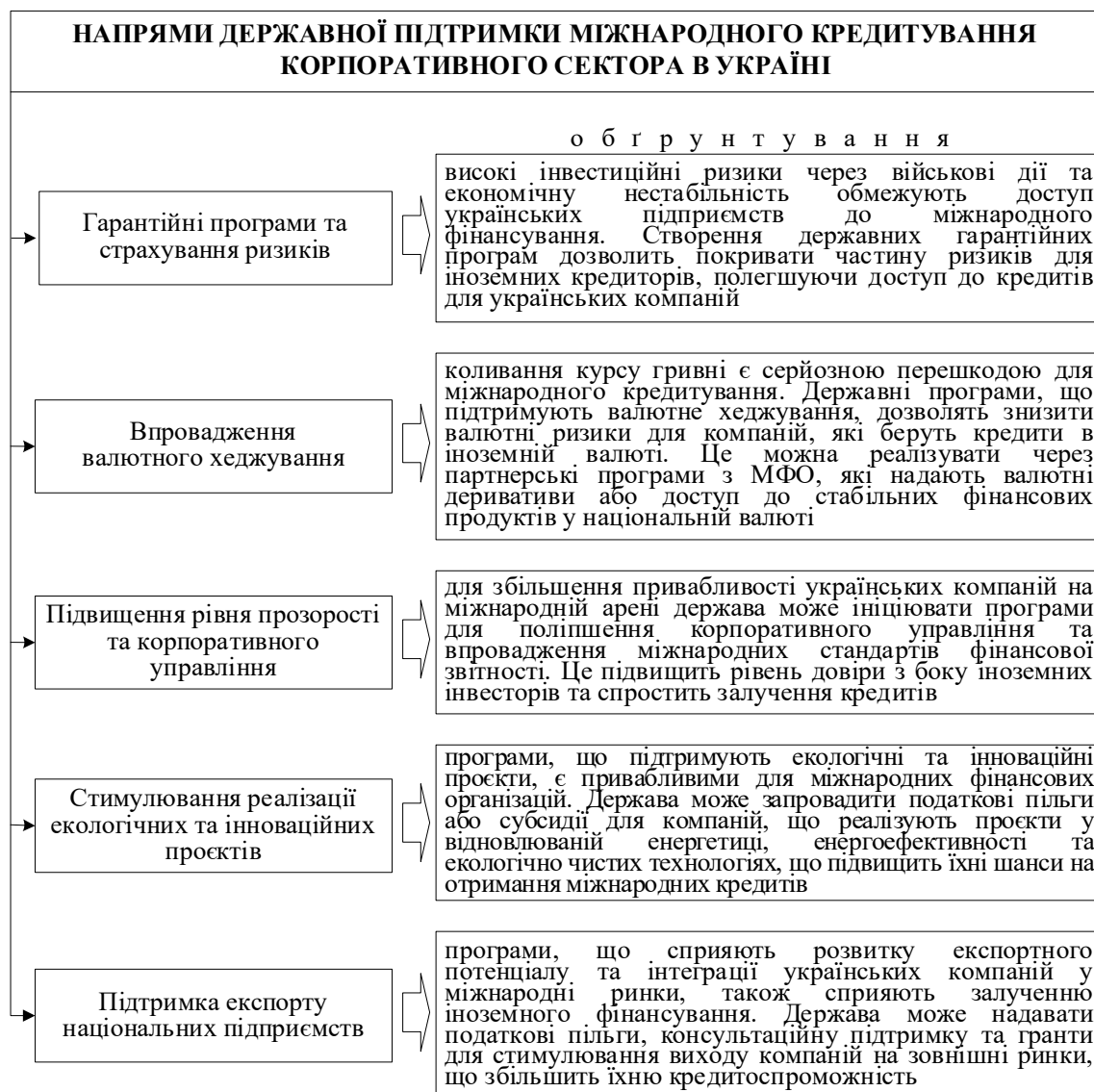
Рис. 3. Основні напрями державної підтримки міжнародного кредитування корпоративного сектору