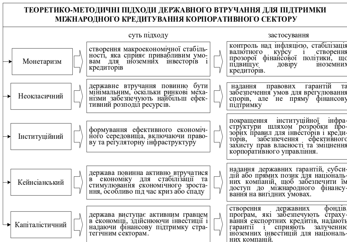
Рис. 1. Основні підходи державного втручання для підтримки міжнародного кредитування корпоративного сектору

В економічній теорії є низка підходів щодо державного втручання для підтримки міжнародного кредитування, кожен із яких пропонує різні методи та механізми стимулювання корпоративного сектору економіки до міжнародного кредитування. Серед основних підходів можна виокремити монетаризм, неокласичний, інституційний, кейнсіанський, капіталістичний, які схематично представлені на рис. 1.