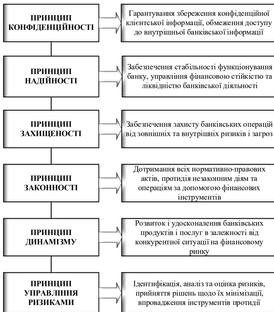
Рис. 2. Комплекс управлінських принципів забезпечення стратегічної фінансової безпеки банку