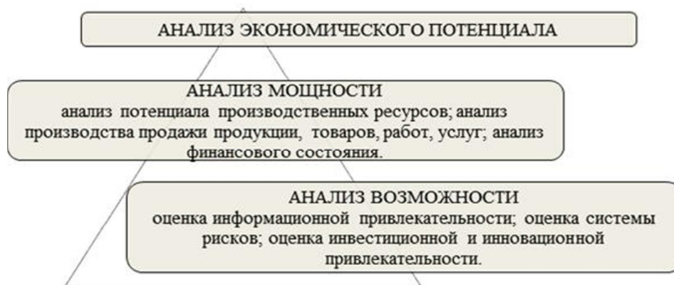
Рис. 2. Этапы анализа экономического потенциала организации