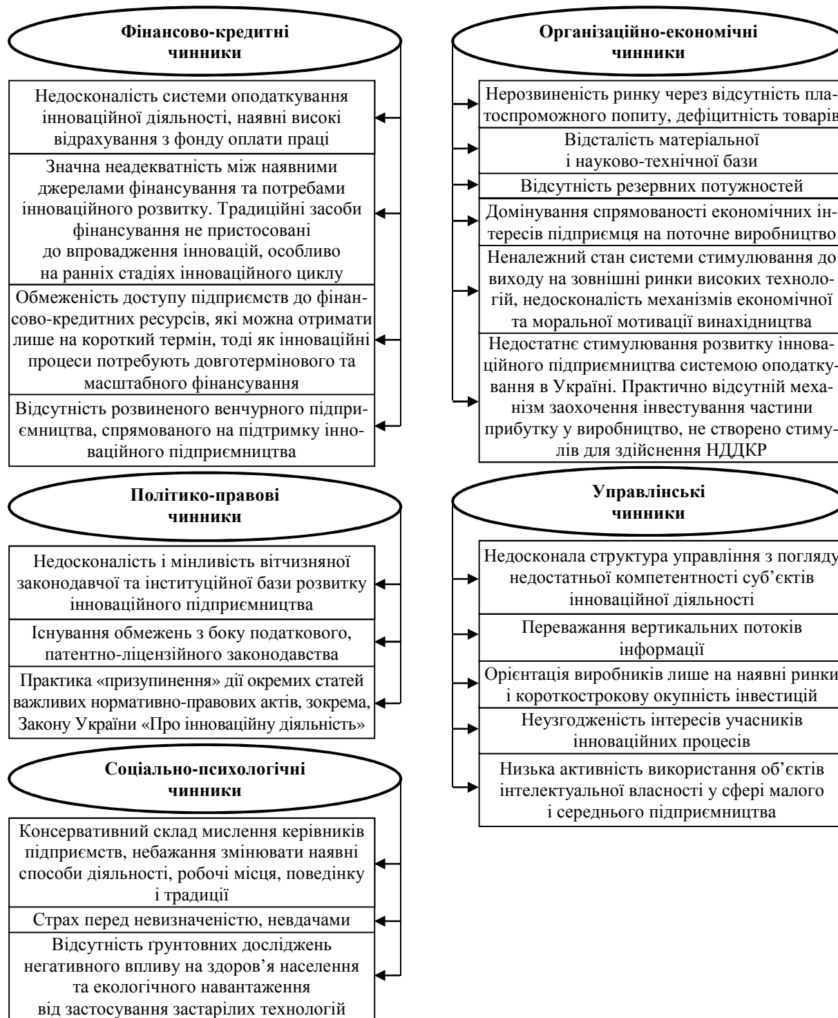
Рис. 3. Агреговані групи факторів стримування інноваційного розвитку легкої промисловості України

Безперечно, вітчизняна промисловість страждає від зазначених недоліків. Але, на нашу думку, головна причина криється у дещо іншій площині. Йдеться про нерозвиненість інституційного середовища, яке мало б спрямовувати наявні фінансові та інформаційні потоки у пріоритетні для країни, а не окремих господарюючих суб'єктів, підприємницькі сфери.