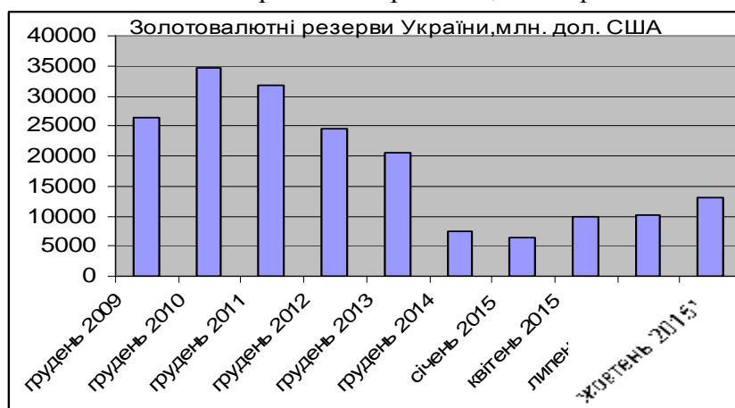
Рис. 1. Міжнародні золотовалютні резерви України станом на кінець 2009–2014 рр. та січня/квітня/липня/жовтня 2015 1 р. (млн дол США)

У 2015 р. Україна поступово відновлює міжнародні резерви. З початку року вони подвоїлись і станом на 31.10.2015 р. досягли рівня 12,962 млрд дол США (рис. 1).