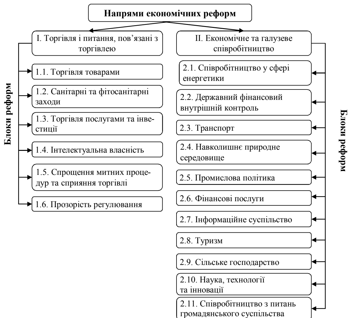
Рис. 2. Напрями економічних реформ, що визначені Угодою про асоціацію між Україною та ЄС Джерело: побудовано за [1].

Для їх опису слід відібрати легковимірювані статистичні індикатори, інформація щодо яких є у публічному доступі: